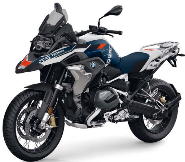
BMW R 1250 GS Trophy inkl. SA-Nr. 457