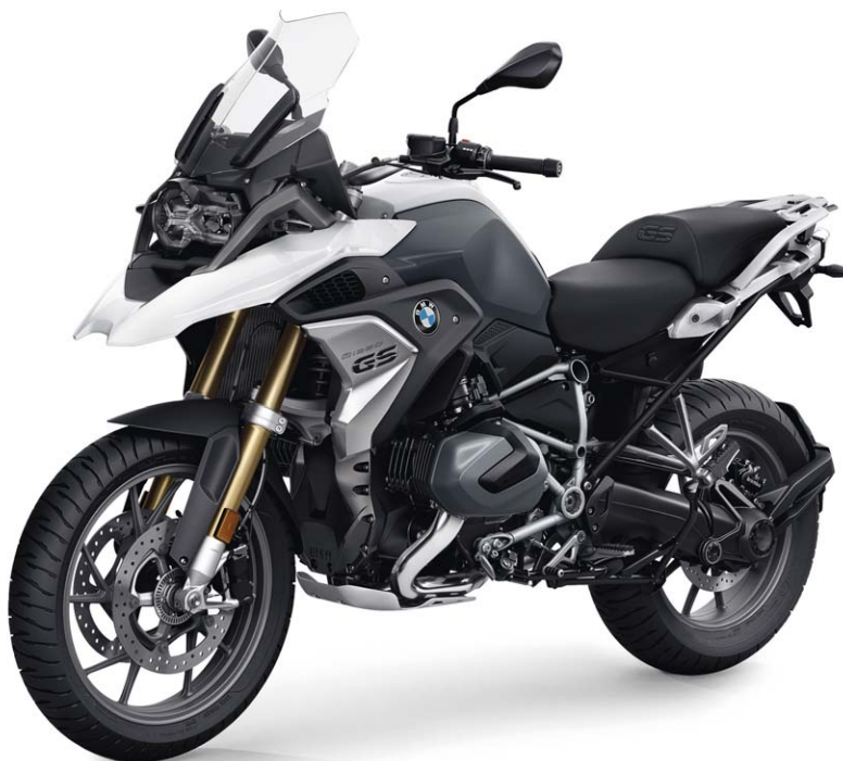
BMW R 1250 GS Fahrzeugpreis

BMW R 1250 GS Fahrzeugschlüssel-Nr. 0M01