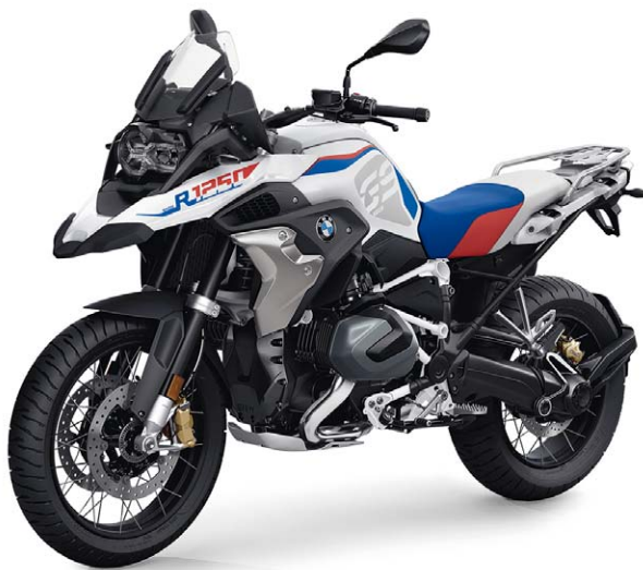
BMW R 1250 GS Rallye inkl. SA-Nr. 453