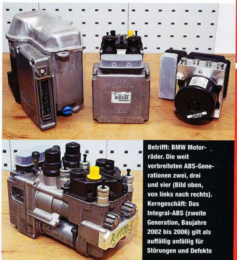
Betrifft: BMW Motorräder. Die weit verbreiteten ABS-Generationen zwei, drei und vier (Bild oben, von links nach rechts). Kerngeschäft: Das Integral-ABS (zweite Generation, Baujahre 2002 bis 2006) gilt als auffällig anfällig für Störungen und Defekte

Viele Betroffene versuchen, die Kosten auf ein akzeptables Maß zu reduzieren, indem sie nach gebrauchten Druckmodulatoren Ausschau halten. Doch Herkunft und Vorgeschichte dieser im Internet oder von Teilhändlern angebotenen Geräte können meist nicht lückenlos nachvollzogen werden. Ein erneuter Defekt schon nach kurzer Zeit kann nicht ausgeschlossen