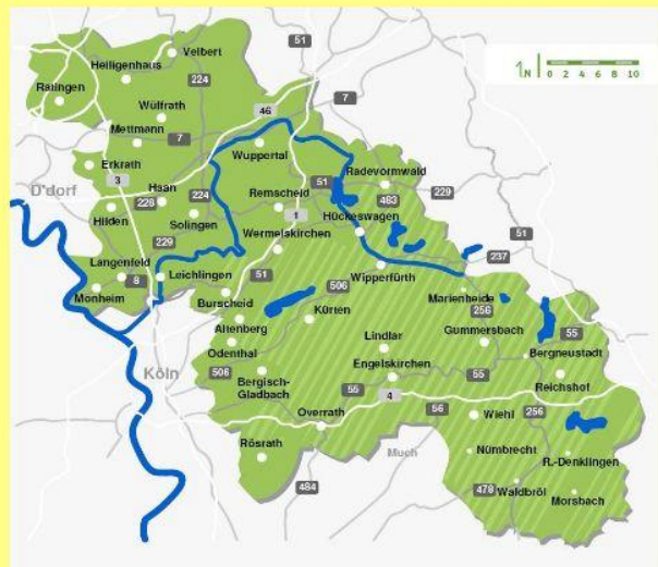
Übersichtskarte Bergisches Land

Das Bergische Land umfasst ein Gebiet von ca. 2000 qkm und liegt im Westen Deutschlands. Eingefasst von den ausläufern des Sauerlandes im Osten, dem Westerwald im Süden, der niederrheinischen Tiefebene im Westen und dem Ruhrgebiet im Norden. Die Region hat sich seine Ursprünglichkeit und Kultur bewahrt wie selten eine andere Landschaft in Deutschland. Sie gehört zu einen reizvollsten überhaupt. Die Grafen von Berg, die der Region ihren Namen und ihr Wappenzeichen, den roten Löwen, gaben hinterließen ihre Spuren überall. Bei den typischen bergischen Häusern findet man die Landesfarben schwarz, weiß und grün wieder: Schwarz-weißes Fachwerk mit den typischen grünen Fensterläden. Die ausgesproche farbige Landschaft mit unzähligen Hügeln und Tälern und seinen kurvenreichen großen und kleinen Strassen ist ein ideales Tourengebiet für Motorradfahrer. Das als Mittelgebirge gekennzeichnete Gebiet ist stellenweise bis zu 500 Metern über NN. Dadurch ergibt sich bei gutem Wetter und den richtigen Strecken eine fantastische Weitsicht.