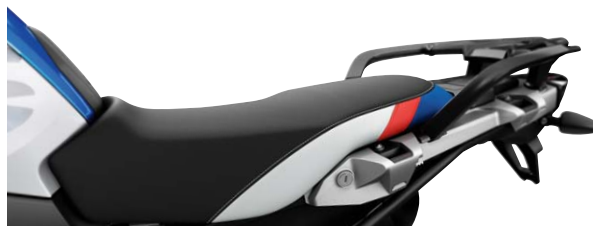
13 Rallye-Sitzbank niedrig mit Gepäckplatte