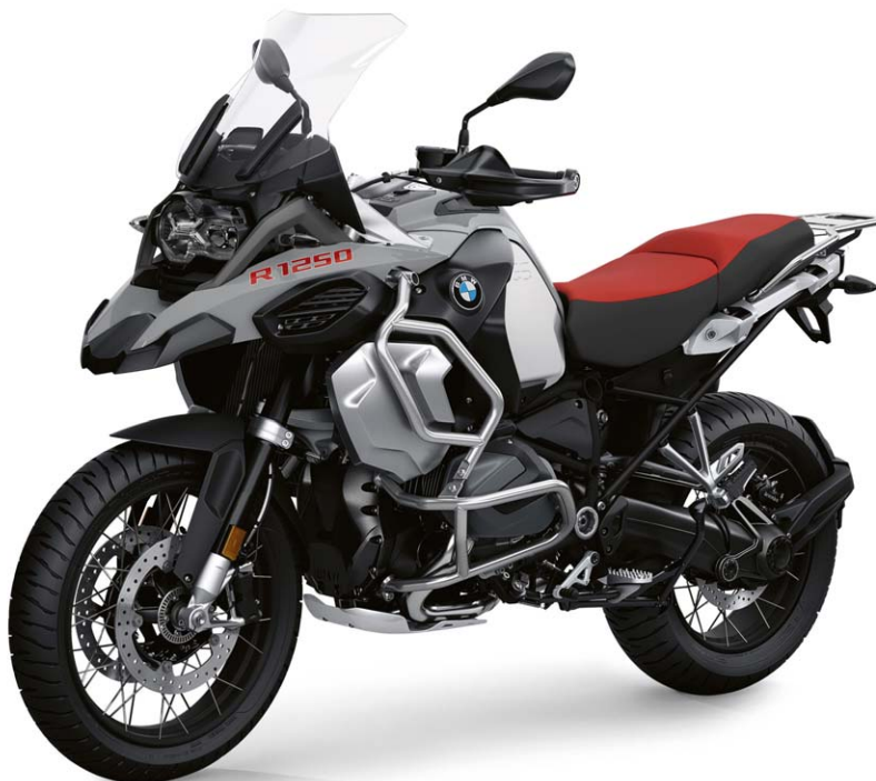
BMW R 1250 GS Adventure Fahrzeugpreis

BMW R 1250 GS ADVENTURE Fahrzeugschlüssel-Nr. 0M11