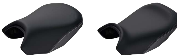
10 Fahrersitz Exclusive hoch und niedrig