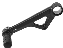
9 Schalthebel einstellbar schwarz