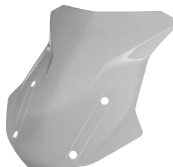
7 Windschild hoch getönt