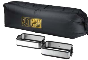
4 Volumenerweiterung silber