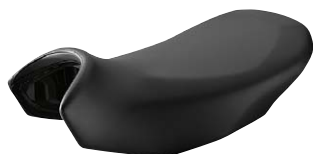
12 Fahrersitz niedrig