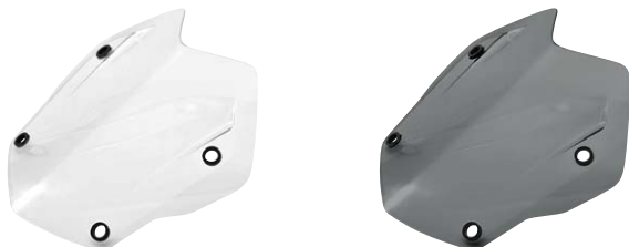
6 Windschild Rallye klar oder getönt