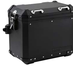
2 Aluminium-Koffer schwarz