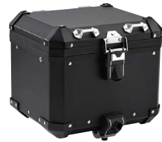
3 Aluminium-Topcase schwarz