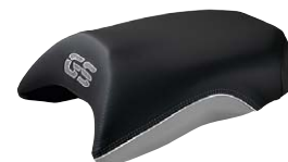
11 Soziussitz Exclusive