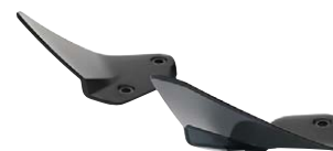
8 Windabweiser getönt