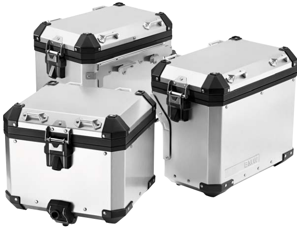
1 Aluminium-Gepäcksystem silber