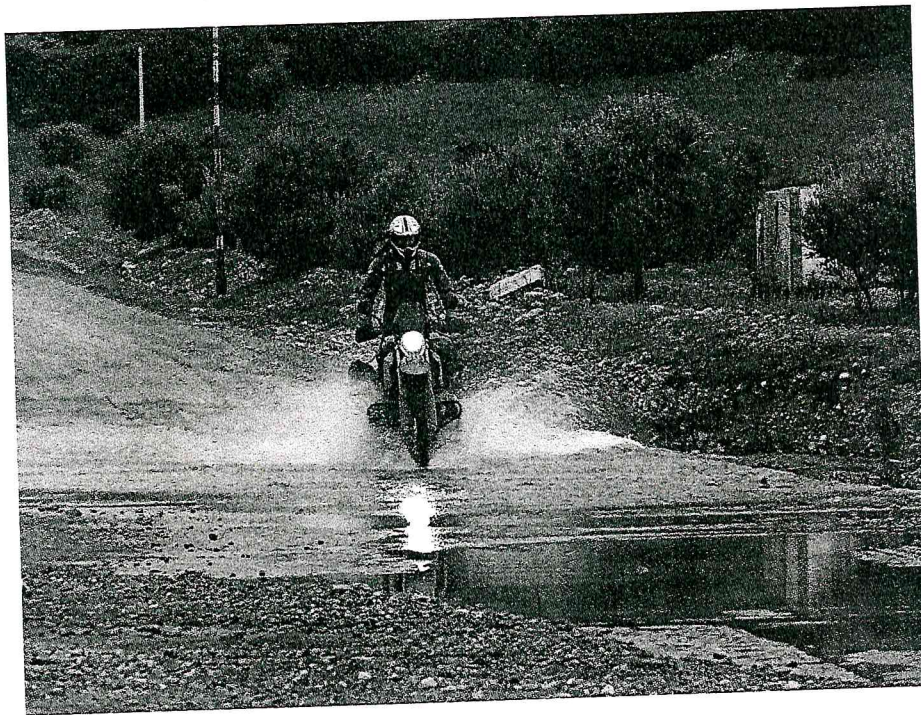
Fotos, Wasserdurchfahrt, soviel Zeit muss sein.