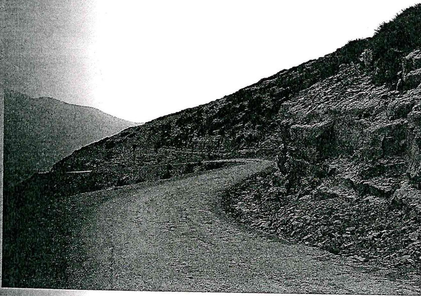
Fotos, tolle Strecke über das Atlasgebirge.

Die Aussicht war fantastisch. Der große Vorteil gegenüber den Alpen war, dass außer uns niemand hier war und wenn ich sage niemand, dann meine ich niemand, nicht einmal ein Souvenirverkäufer, die eigentlich überall auf einen warteten.