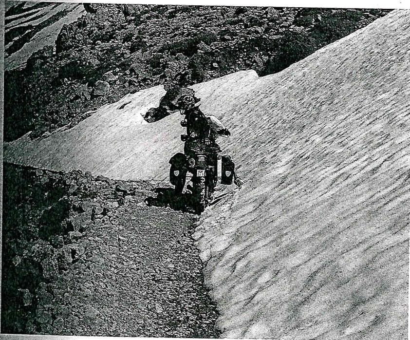
Fotos, Schnee direkt voraus.