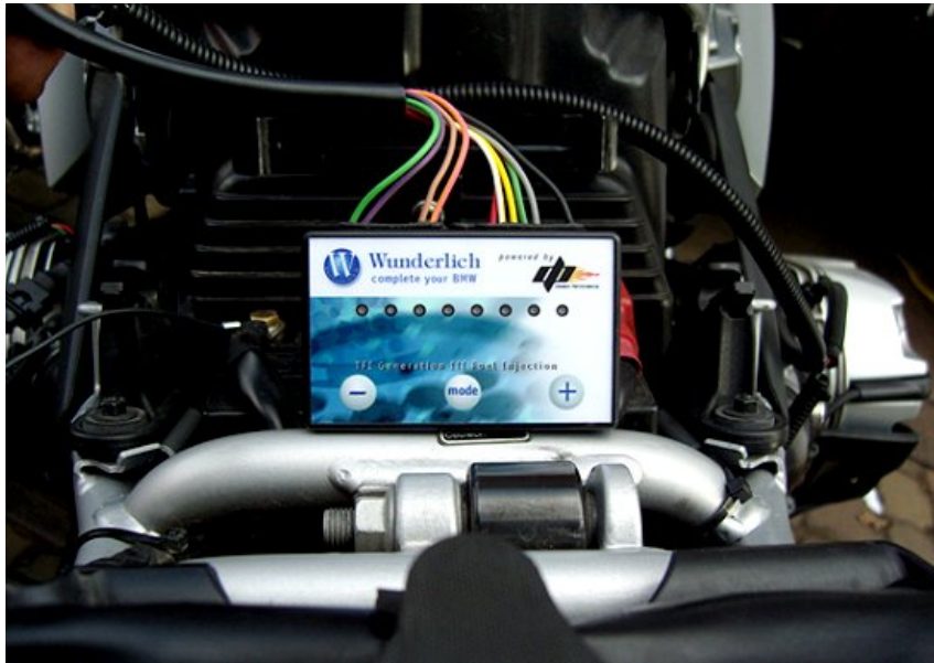
Performance Controller von Wunderlich

Er ist mit ca. 300,- Euro das günstigste Gerät im Vergleich. Die Einbau- und Bedienungsanleitung könnten etwas aufschlussreicher sein, reichen aber aus. Der Performance Controller wird an die Lambdasonden und die Einspritzdüsen angeschlossen. Eine Programmierung ist nur über Tasten direkt am Gerät möglich. Die Kurve kann sich aber durchaus sehen lassen.