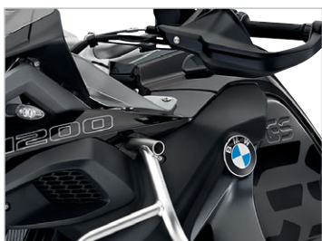
R 1200 GS Adventure Exclusive Blackstorm metallic / Schieferdunkel metallic matt / Achatgrau N1H / Sitzbank schwarz *3 (Hauptrahmen Achatgrau / Heckrahmen schwarz)