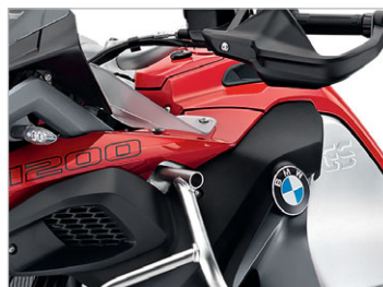
Racingred uni NA5 / Sitzbank rot/schwarz (Hauptrahmen Aluminiumsilber / Heckrahmen schwarz)