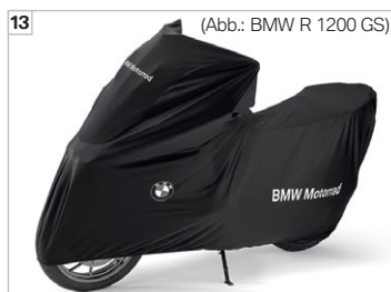
(Abb.: BMW R 1200 GS)